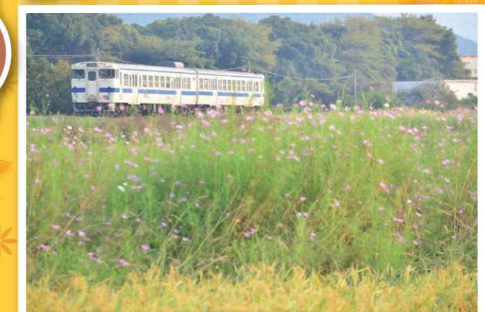
のんびり。夕暮れの日田彦山線 最近のKOさん