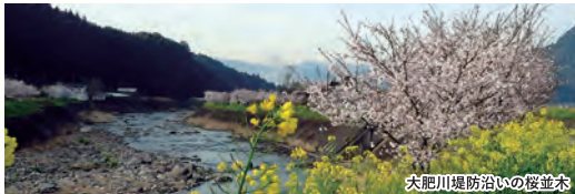
大肥川堤防沿いの桜並木

桜並木と菜の花が美しい大肥川堤防沿いのコースです。また、大鶴は酒どころとしても知られ、途中、井上酒造の清溪文庫や老松酒造の鰻絵(こてえ)などがご覧になれます。